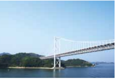
「瀬戸内海の海を体験したい」と言う方も多いそう。青空の下、海上からの美しい大橋は一見の価値あり

「クルーズ初参加の方は、どのようなきっかけが多いですか？」 なにかの節目、たとえば退職記念や結婚記念日、誕生日、金婚式などの方が多くいますね。いつもの旅より、ちょっと特別感があるのではないのでしょうか。最近では、若い世代に船上結婚式の人気が高まっています。多くの乗船客の祝福は、とても感動しますね。 「また、シニア世代に入ると配偶者に先立たれる方もいらっしゃると思います。気持ちが少し落ち着き、一歩あゆみだそうとする際に、クルーズ旅行を選ばれることがあるようです。ひとり参加でもクルーズでは目立たないので気楽です。ご夫婦で参加されても別々に行動することも多いので友人になりやすく、何よりも船旅に癒されます。そんな旅を通じて「自信」がつくのでしょうか。多くの方がクルーズ・ピーターになるようです。」