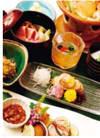
「日本船のメリット」ひとつは、和食の充実さ。“シニア世代は、特に健康管理された和食がとても嬉しい”

「いつかはクルーズ」と思っている方も、初めての体験には不安がつきもの。クルーズ初心者へのサポートを数多くされた経験から、クルーズ旅行のプロにエピソードをお聞きしました。 取材協力: JTB東梅田支店 ロイヤルロード銀座デスク ☎06-6311-3666