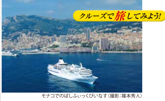
クルーズで旅してみよう!